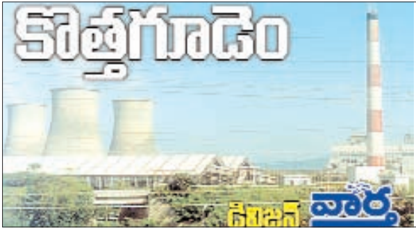
చుంచుపల్లి, జూలూరుపాడు, సుజాతనగర్